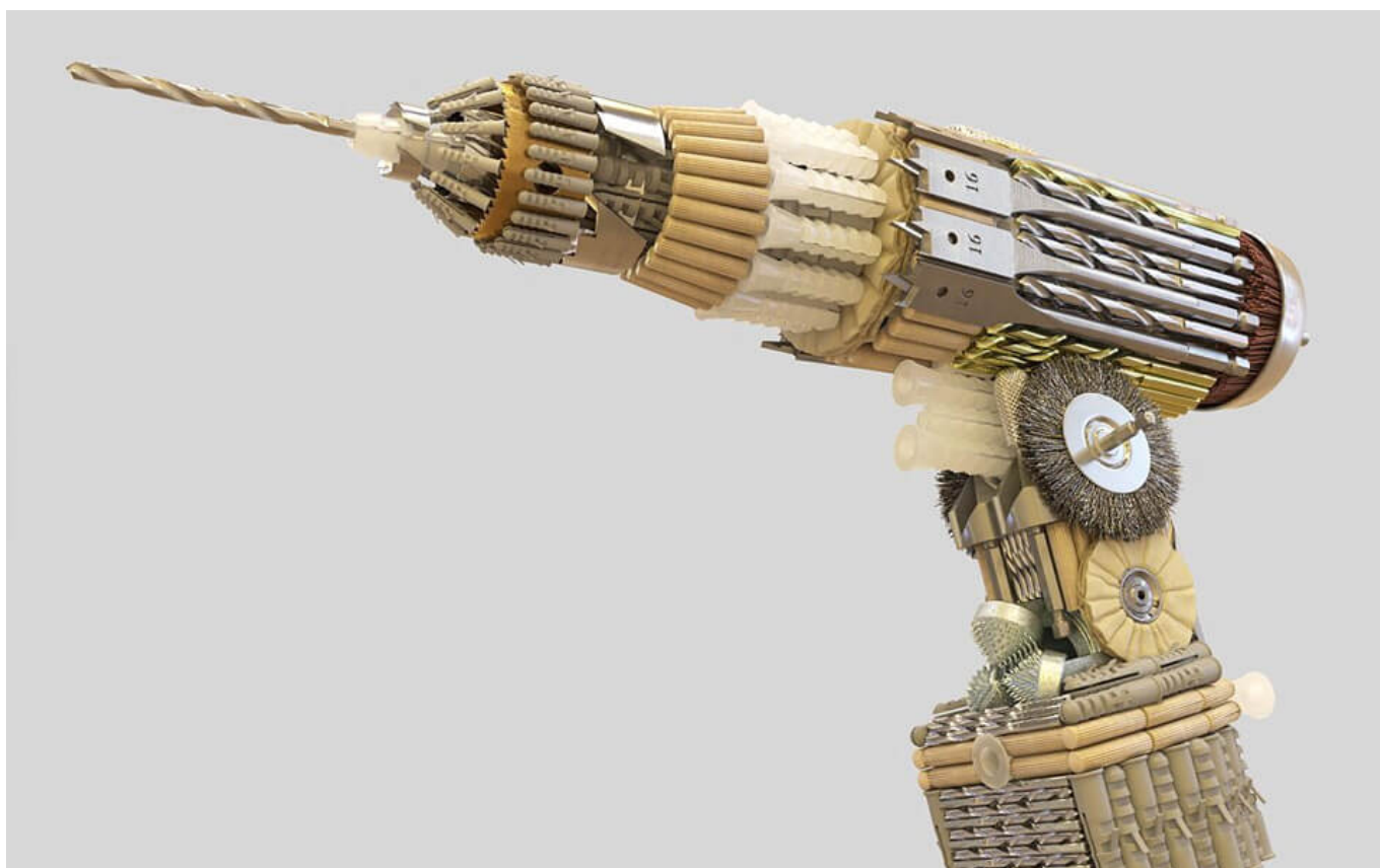
Série Tools , par Luis de la Barrera-Montenegro

Le salaire à vie n'est en cela pas une idée achevée, pleine et entière, qui fonctionnerait comme une recette miracle. Il ne demeure pas moins l'une des rares propositions pratiques et affirmatives à ne