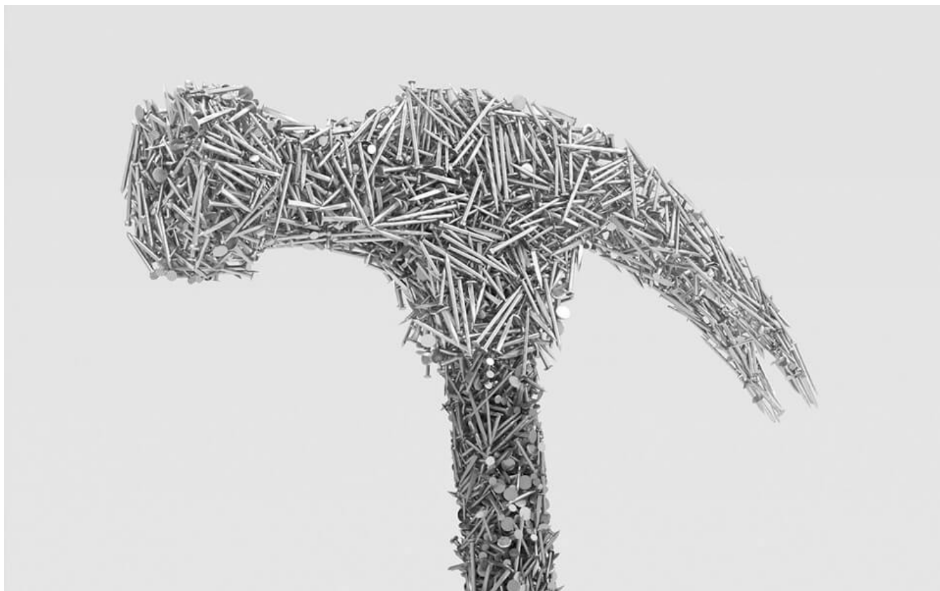
Série Tools , par Luis de la Barrera-Montenegro

L'idéal du capitaliste serait d'être patron sans la contrepartie du code du travail. C'est ce dont témoigne l'ubérisation : les donneurs d'ordre veulent diriger et dégager du profit sans même être employeurs. L'emploi n'est donc pas la pire forme de rapport social qui encadre le travail car des droits lui sont attachés. Mais les individus y sont niés en tant que producteurs, puisque seule leur capacité à être rentable — la vente de leur force de travail — est valorisée. En voulant redéfinir le travail et notre rapport à celui-ci, on se heurte de plein fouet aux cadres de l'emploi et du marché du travail, qui ne sauraient être émancipateurs. Les remettre véritablement en cause est tout le projet du salaire à vie, qui s'appuie sur deux principes : une généralisation de la cotisation et l'attribution de droits à la personne (et non plus au poste qu'elle occupe).