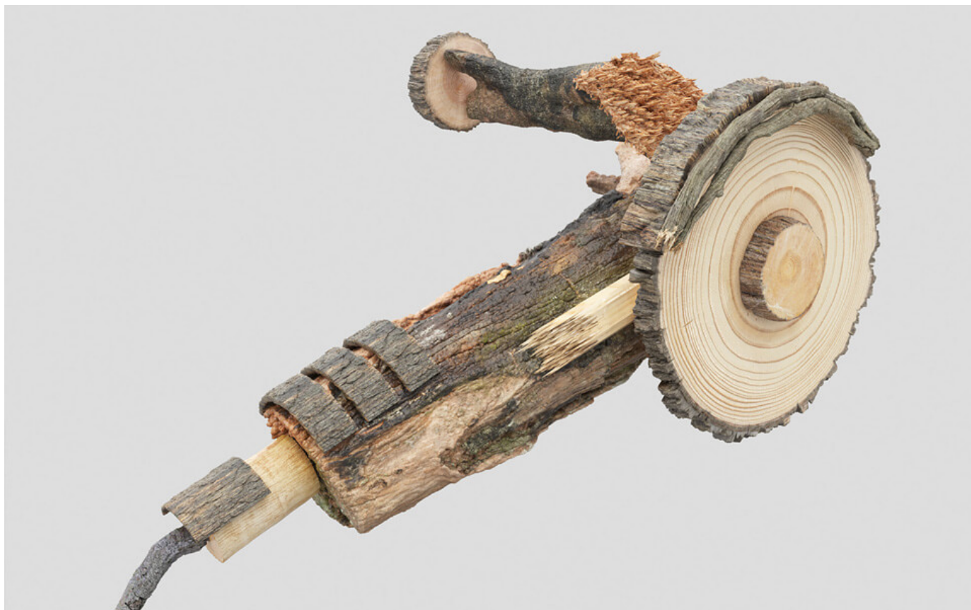
Série Tools, par Luis de la Barrera-Montenegro